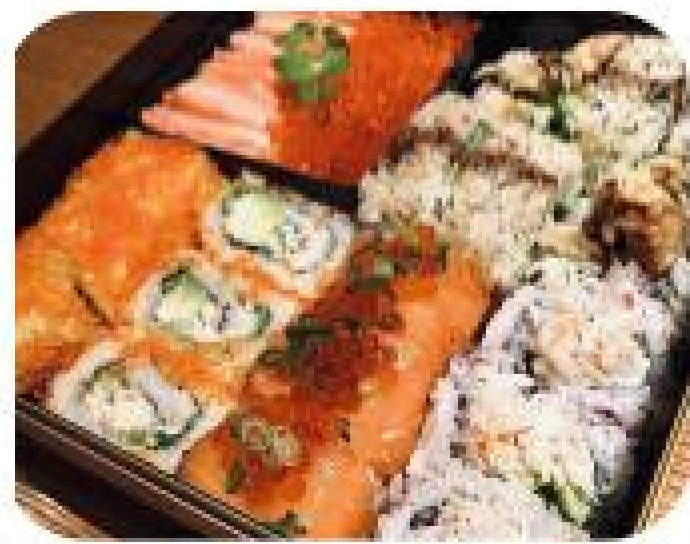
ロール寿司 1本からでもご注文頂けます。