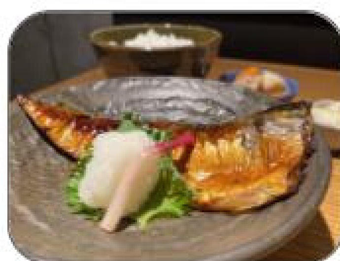
金華サバの西京焼き