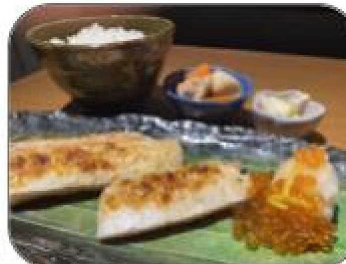
鮭のハラス焼き ～イクラ柚子おろしがけ～