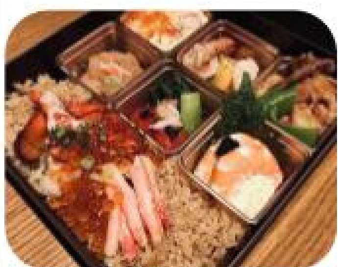
当店大人気のおマール海老と ズワイガニの炊き込みご飯など エビカニづくしスペシャル弁当

+500円で炊き込みご飯をおマール海老と スペシャルEniコンボに変更出来ます。