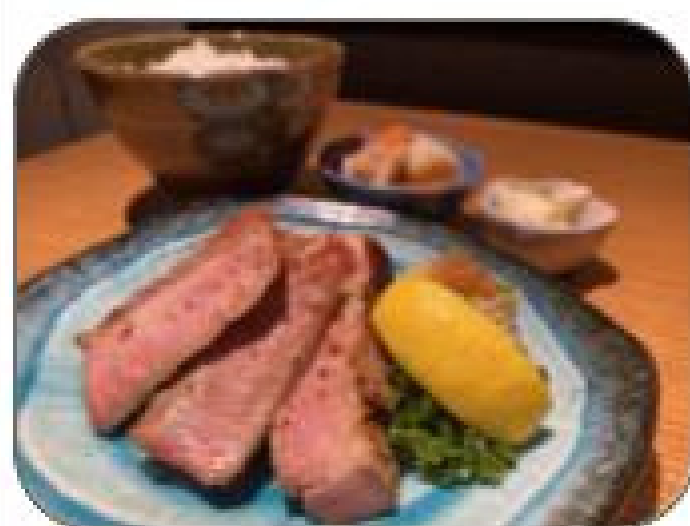
三元豚にんにく醤油麹焼き