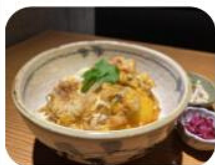
ソフトシェルクラブ ～親子丼風～